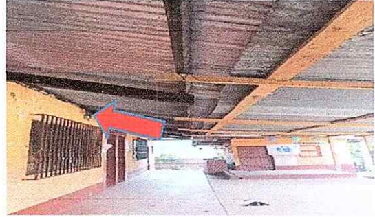
Foto 2: Modulo 2: Aulas con poca ventilación ya que no tiene la altura adecuada.