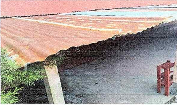
Foto 1: Modulo 1: Laminas dañadas y deterioradas con goteras (tres aulas, corredor, pasillo y cocina.)